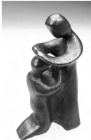
Design: Henriëtte Post